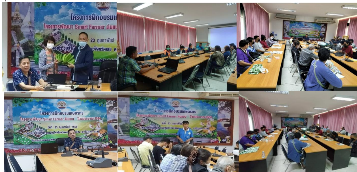
มติที่ประชุม รับทราบ

๓.๙.๑.๓ อบรมเกษตรกรโครงการ Smart Farmer ประจำปีงบประมาณ ๒๕๖๖ วันที่ ๒๒-๒๔ กุมภาพันธ์ ๒๕๖๖ เกษตรกร จำนวน ๓๐ ราย