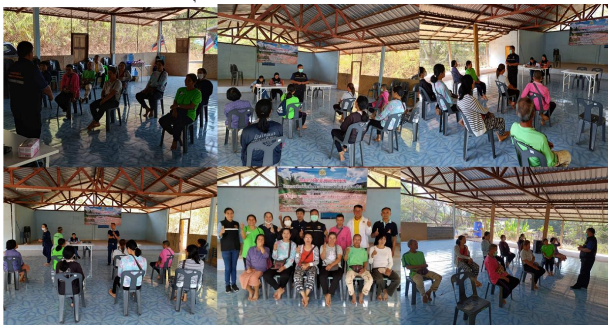
มติที่ประชุม รับทราบ

๓.๙.๑.๒ อบรมเกษตรกรโครงการ รั้งน้ำเพื่อพระแม่ของแผ่นดิน อ.ด่านซ้าย จ.เลย ประจำปี งบประมาณ ๒๕๖๖ เมื่อวันที่ ๑๔ กุมภาพันธ์ ๒๕๖๖ เกษตรกรเข้ารับการฝึกอบรม จำนวน ๑๐ ราย