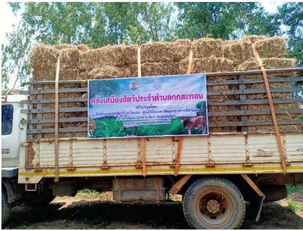
คลังเสบียงสัตว์แห่งชาติ