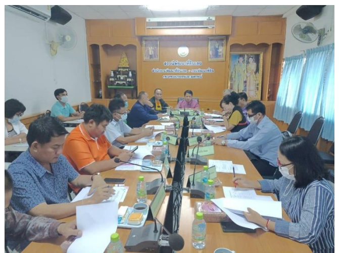
วันที่ ๒๐ กรกฎาคม ๒๕๖๖ ณ สำนักงานสถานีพัฒนาที่ดินเลย