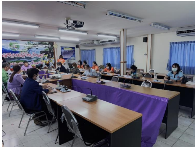
วันที่ ๗ มิถุนายน ๒๕๖๖ ณ สำนักงานสหกรณ์จังหวัดเลย

การประชุมคณะกรรมการบริหารศูนย์ติดตามและแก้ไขปัญหาภัยพิบัติด้านการเกษตรจังหวัดเลย