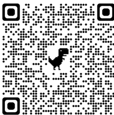
แบบสำรวจข้อมูลสถานที่ จำหน่ายเนื้อสัตว์

โดยให้สำนักงานปศุสัตว์อำเภอทำการกรอกข้อมูลตามแบบฟอร์มไฟล์ Microsoft excel แบบออนไลน์ (Spreadsheets) ซึ่งสามารถเข้าถึงที่อยู่ไฟล์ได้จาก QR code ที่แนบมาพร้อมนี้ ภายในวันที่ ๒๕ กันยายน ๒๕๖๖ เพื่อให้สำนักงานปศุสัตว์จังหวัดเลยทำการรวบรวมและส่งข้อมูลให้สำนักงานปศุสัตว์เขต ๔ ต่อไป