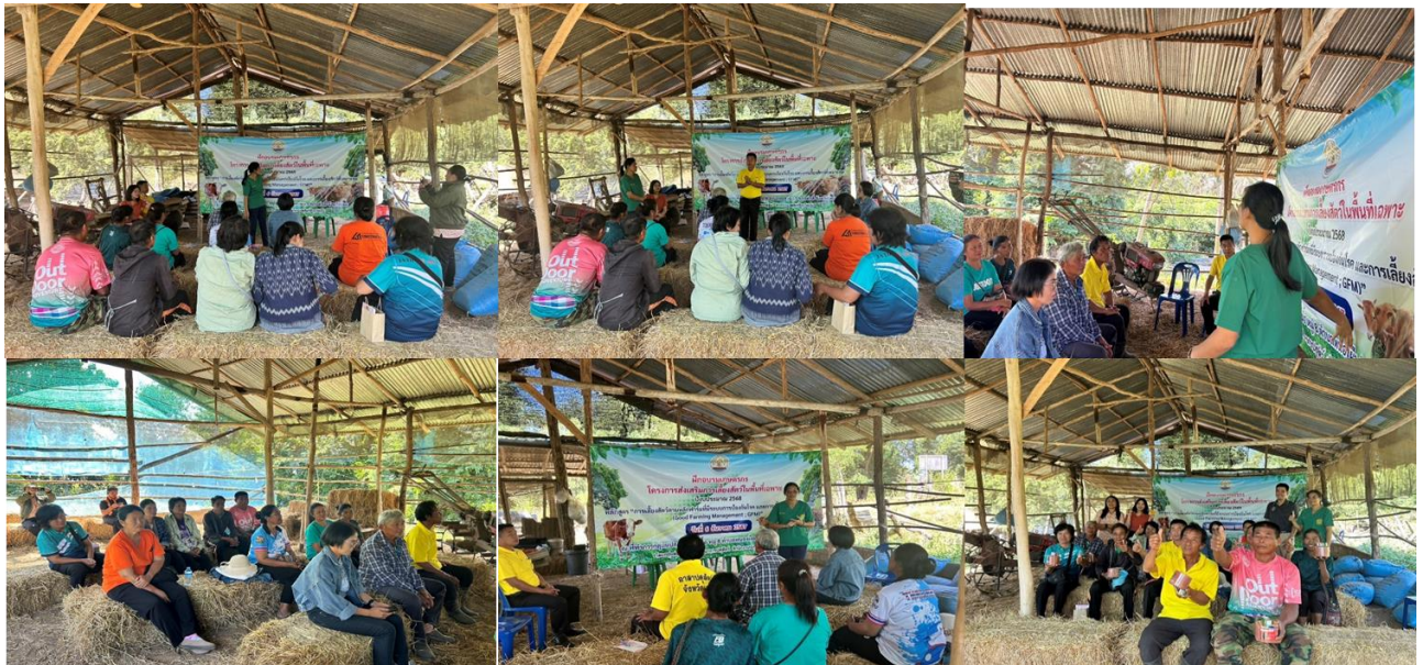
มติที่ประชุม รับทราบ

(๔) ฝึกอบรมเกษตรกรโครงการส่งเสริมการเลี้ยงสัตว์ในพื้นที่เฉพาะเกษตรกร จำนวน ๑๐ ราย ณ ที่ทำการกลุ่มแปลงใหญ่โคเนื้อท่าลี่ ต.หนองผือ อ.นาแห้ว จ.เลย